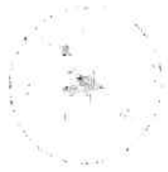
Figure 9: [Faint text describing a figure]

Figure 8: [Faint text describing a figure]