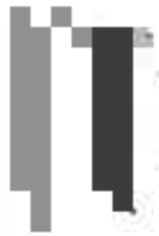
Figure 1: [Faint text describing a figure]

Figure 2: [Faint text describing a figure]