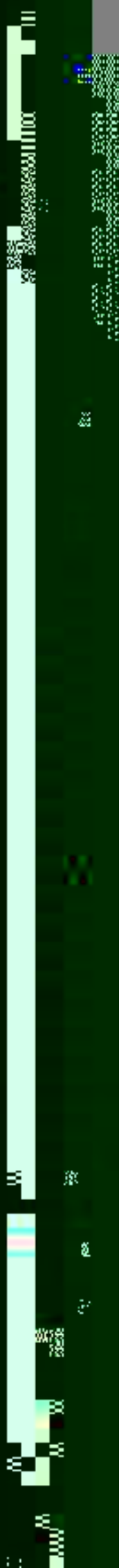
Figure 7: Schematic diagram of the experimental setup.

Figure 6: Schematic diagram of the experimental setup.